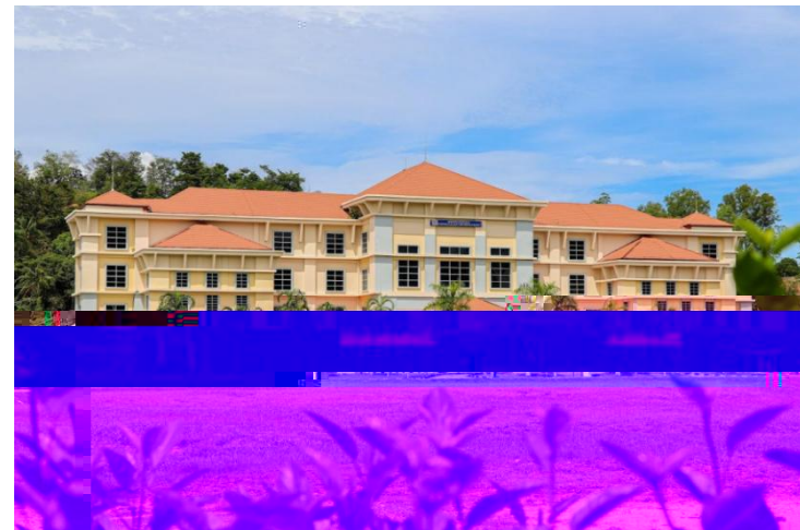
Tunku Abdul Rahman Library