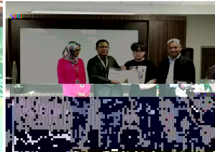
Certificate of Completion Grant