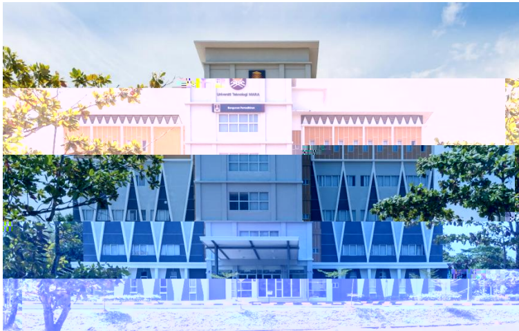
Administration Building / Rectorate