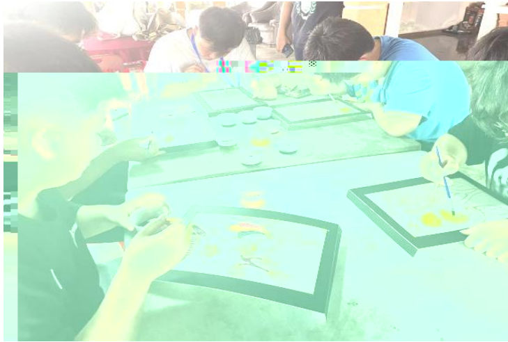
Experience Wax Painting&Drawing