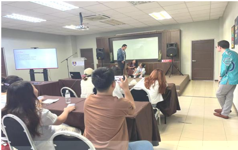
English Enrichment Course Class